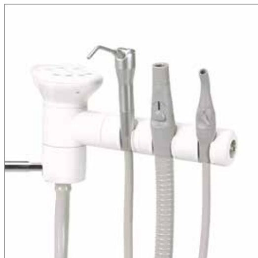
Βάση τριών θέσεων με το προαιρετικό πληκτρολόγιο αφής και τη σύριγγα.

Εργαλεία αναρρόφησης για εύκολη πρόσβαση στον ασθενή χάρη στη βάση τριών θέσεων και τον τηλεσκοπικό βραχίονα.